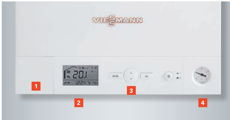
Arıza teşhis sistemine sahip kontrol paneli